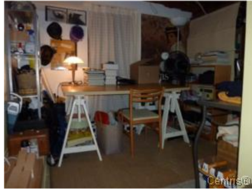
Bureau à domicile