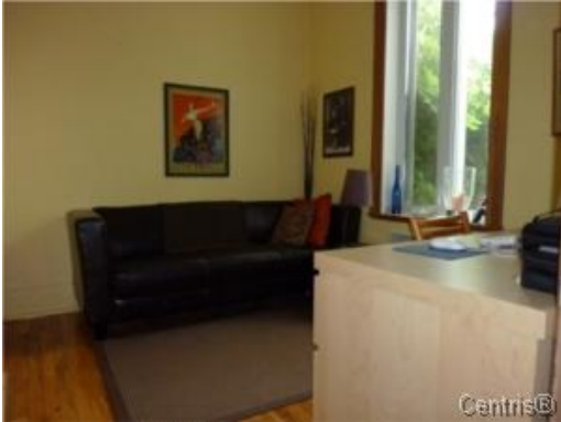
Bureau à domicile